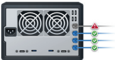
Rysunek 2) Odporny i niezawodny

Kilka portów LAN z obsługą agregacji łączy (Link Aggregation) umożliwia serwerowi DS1513+ działanie z najwyższą wydajnością.