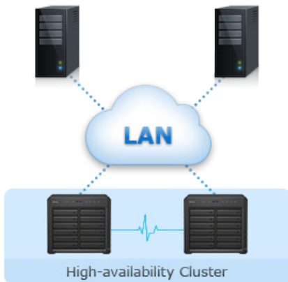
Rysunek 1) Niezawodność, dostępność i przywracanie działania

Synology High Availability zapewnia bezproblemowe przełączanie serwerów w klastrze w przypadku awarii serwera, minimalizując jej wpływ na działalność firmy.